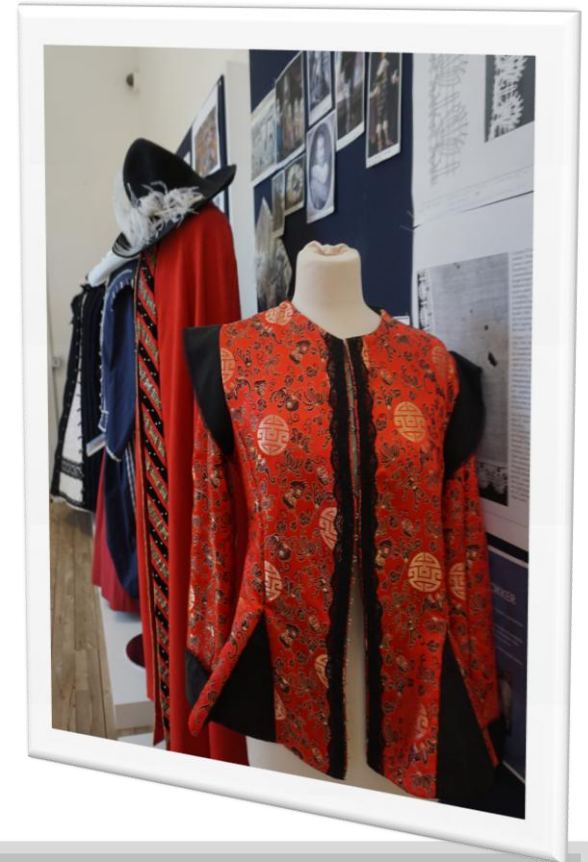
Udstilling fra dragter syet af kostumeafdelingen