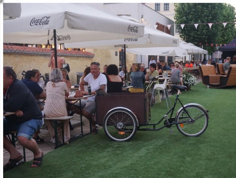
På gågaden lige udenfor var der musik,