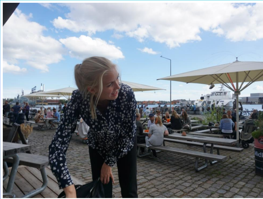
Der kommer chaufføren