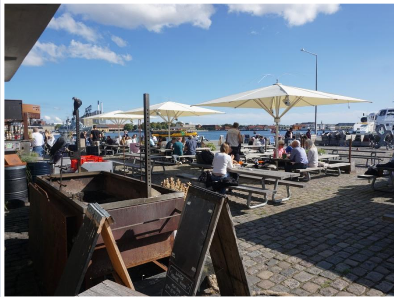
Toldboden - Som I nu kan se, er der kommet gang i fotoapparatet.