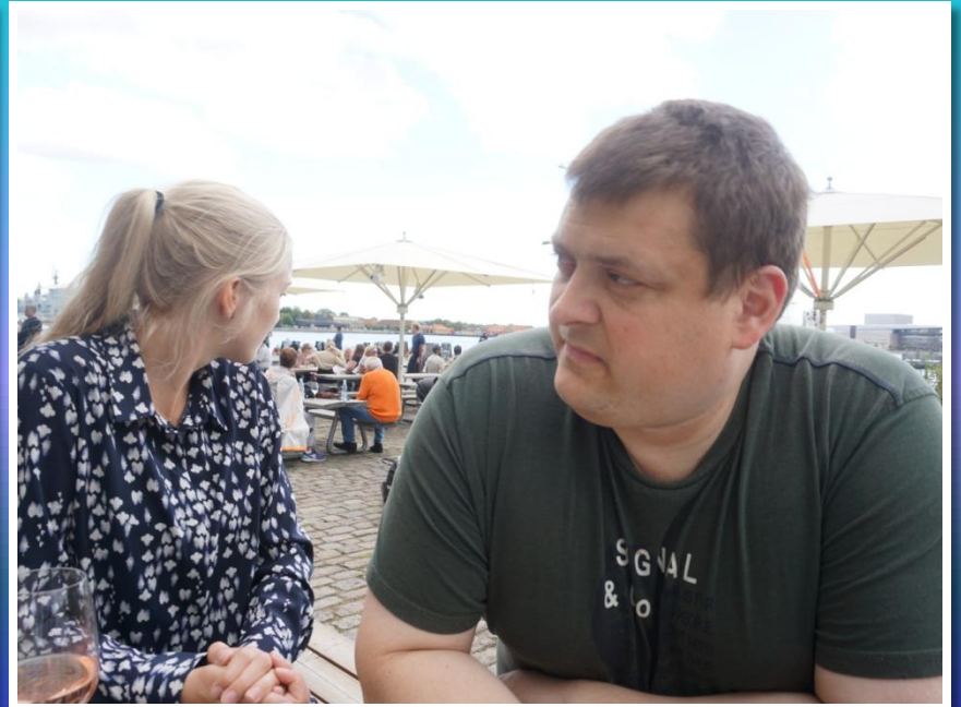
Steen får en cola vi andre et glas vin