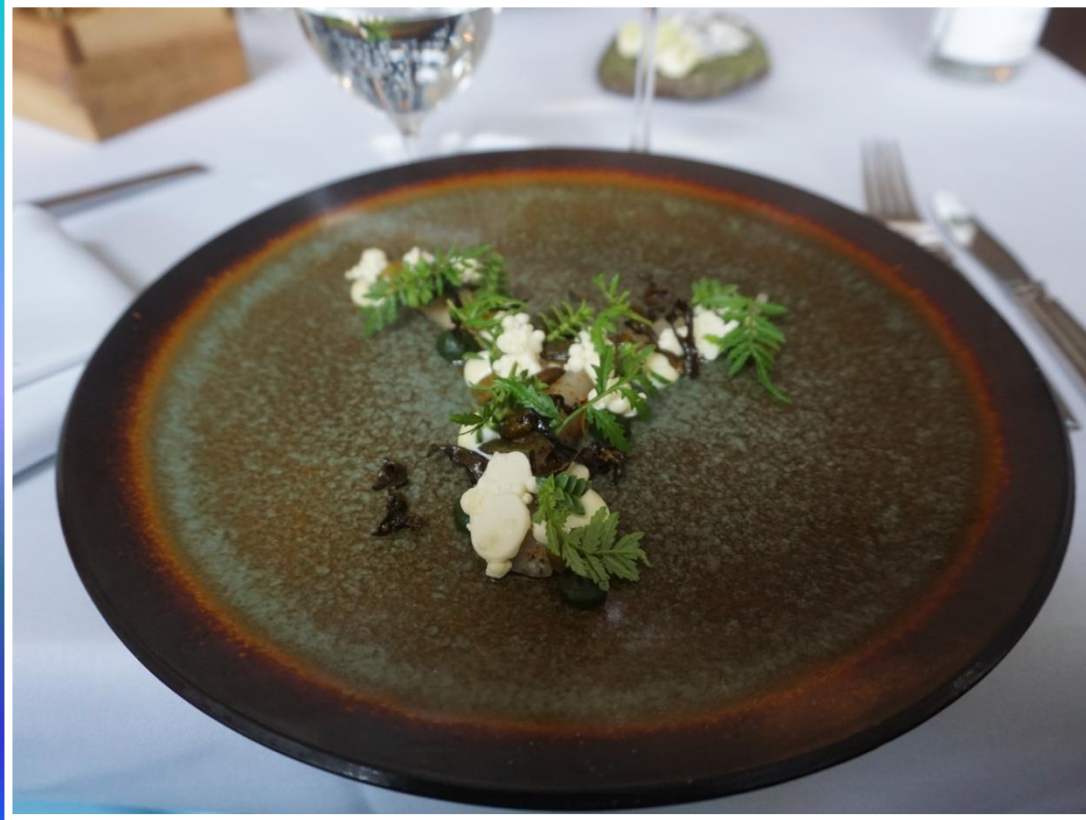
Makrel med tang og peberrod Det smager himmelsk.