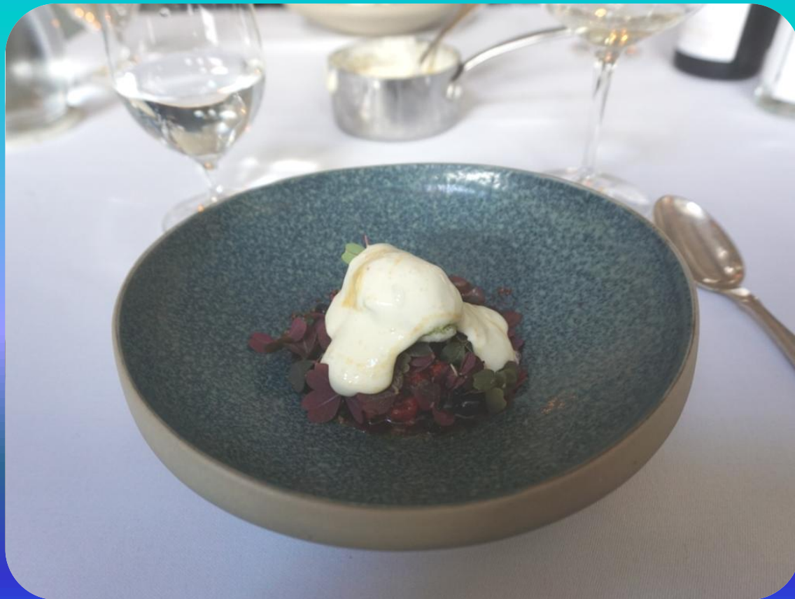
Bær, kærnemælk og saltet karamel