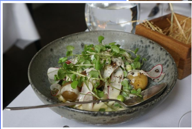
Slethvar med kapers og burre blanc nye kartofler & grillet salat og vinaigrette