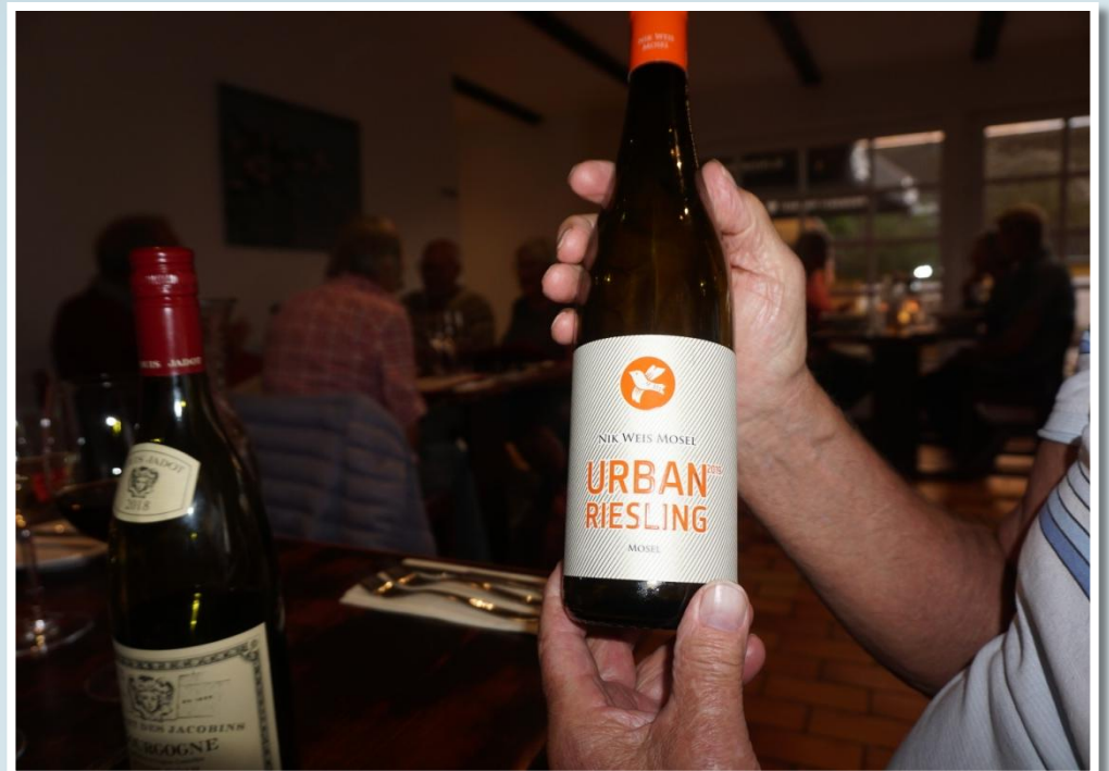
Det er en hyggelig aften.