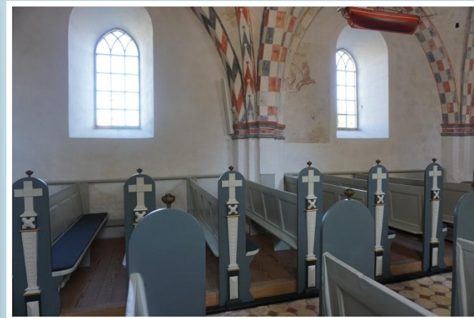
Som slut på besøget på Orø besøges Orø Kirke, der er en vejkirke.