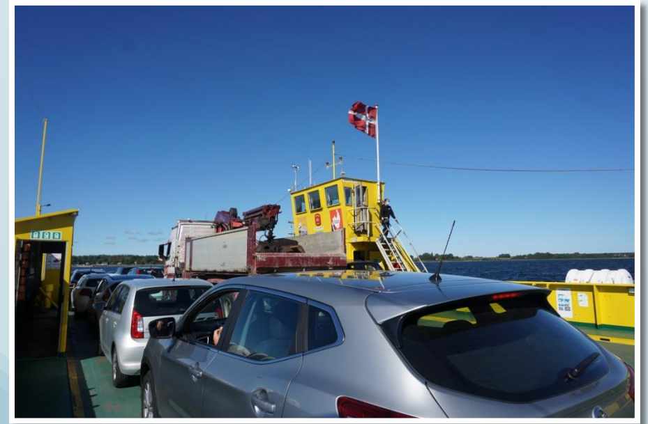
Færgen er fyldt op og lægger fra. Der er frisk vind.