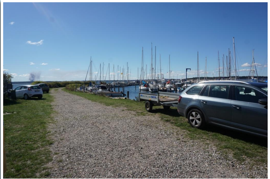
Udsigt langs molen.