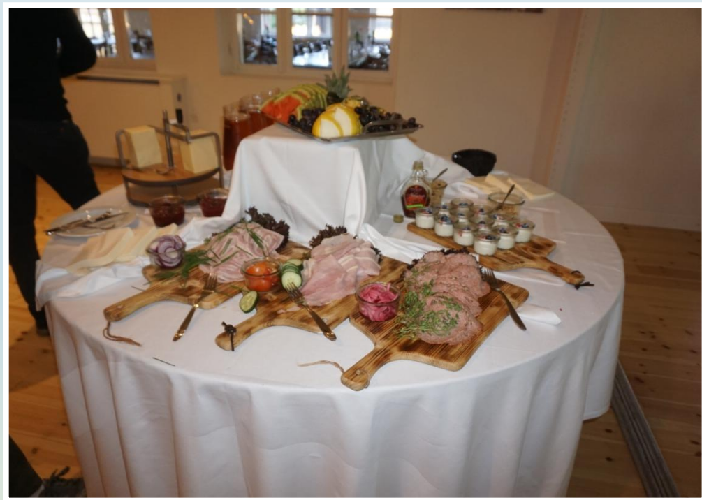
Morgenmaden er super flot.