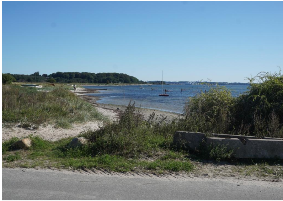
Udsigten mod Frederiksværk