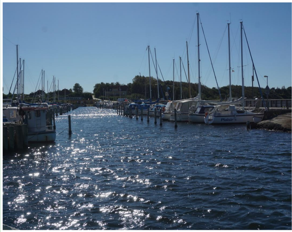
Indsejling i Kulhus Havn.