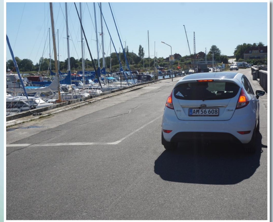
Klar til afkørsel fra Kulhus