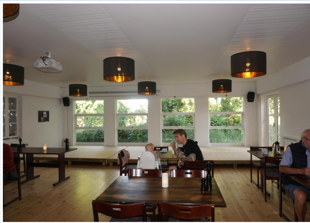
Morgenstuen er fin men lidt dyster.