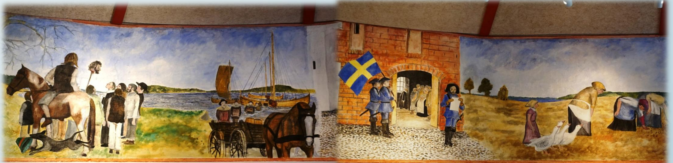
7- Sørøveren Børre