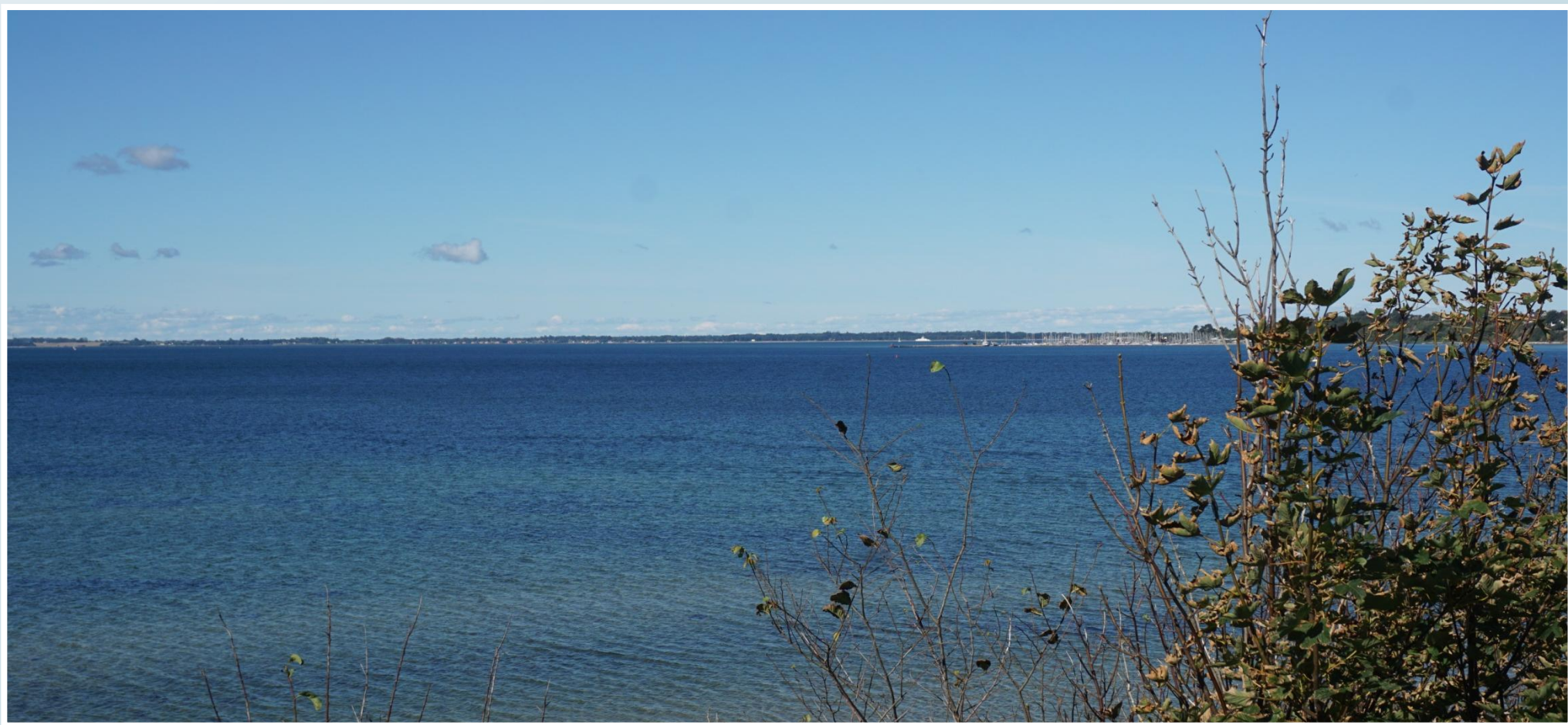
Udsigt fra Kulhus Klint til Lynæs Havn og Hundested Rende.