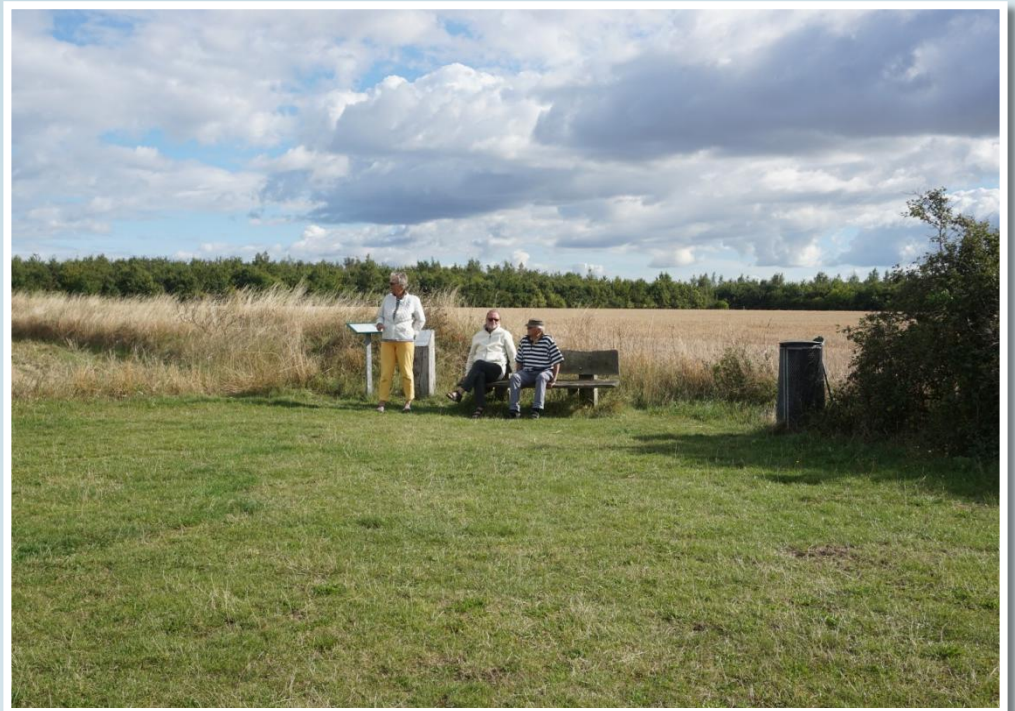
Orøstenen vejer 20 tons