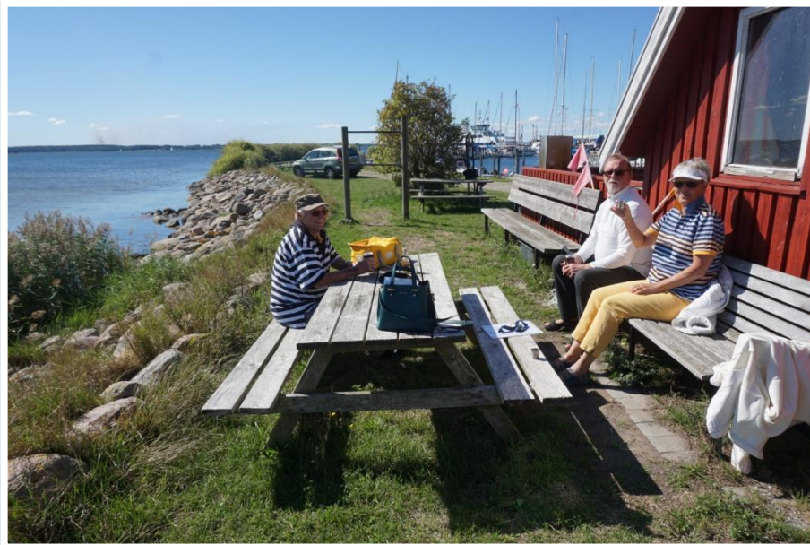
Vi holder drikkepauser og lægger en plan.