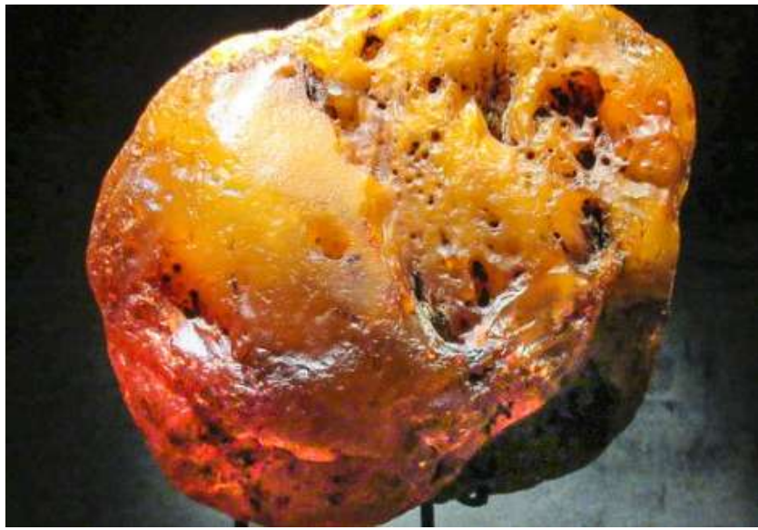
Ravafdelingen - her en meget stor ravklumb