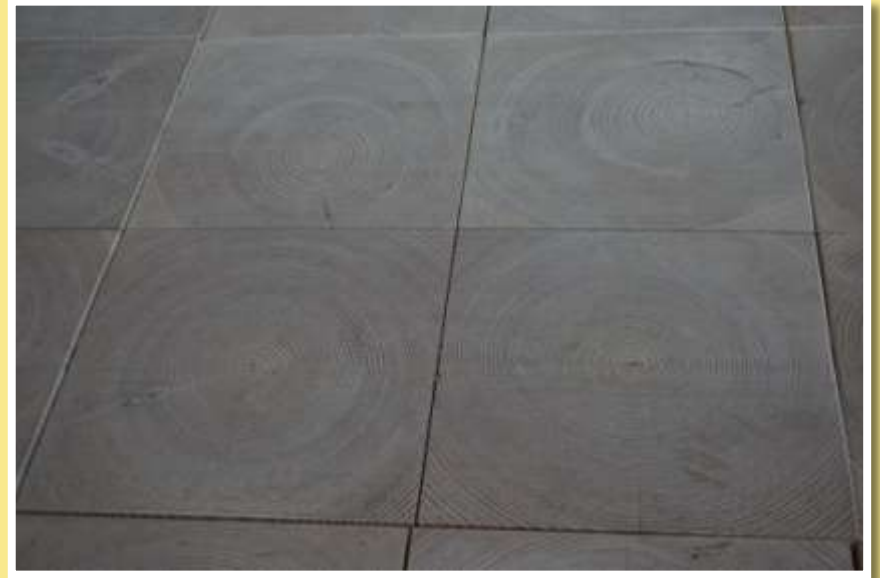
Foredragssal med specielt trægulv