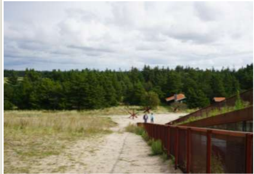
Set oppe fra toppen er centret stort set skjult