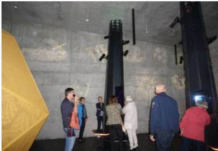
De sorte søjler er udstillingsmontre