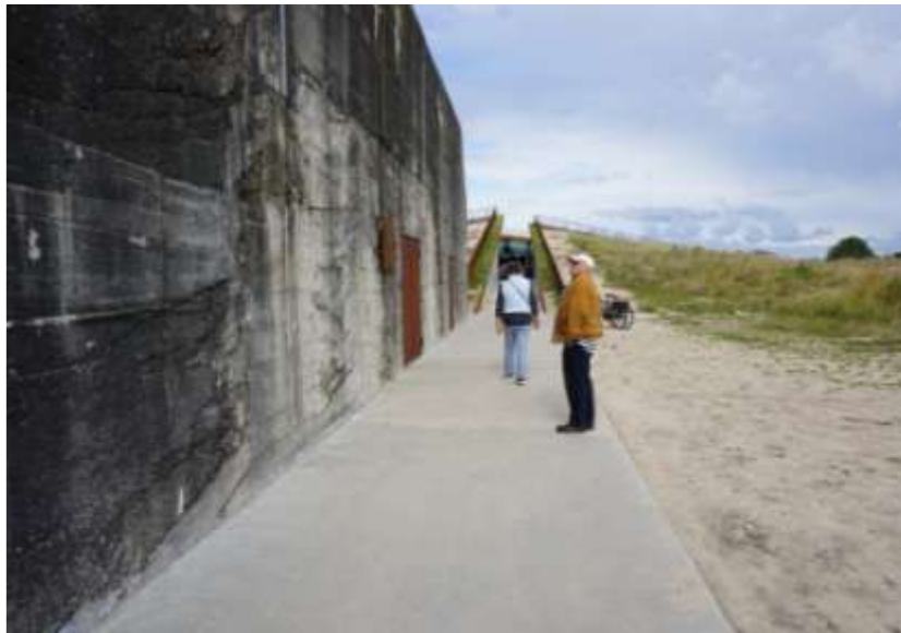
Besøgscenteret set fra parkeringspladsen