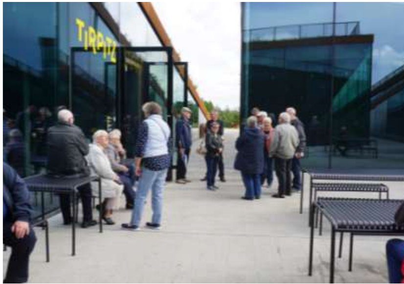
En central plads hvor man kan samles