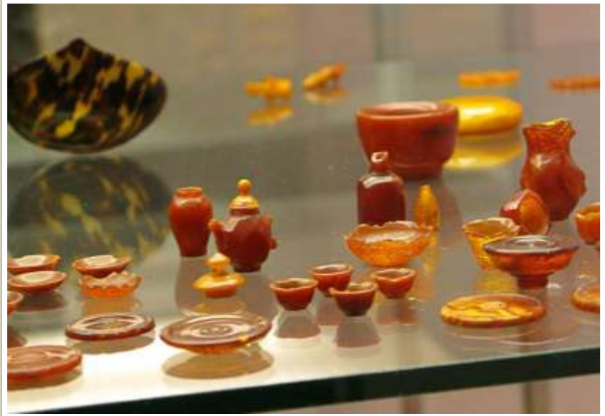
Små nipsting i rav. Her dukke stel.