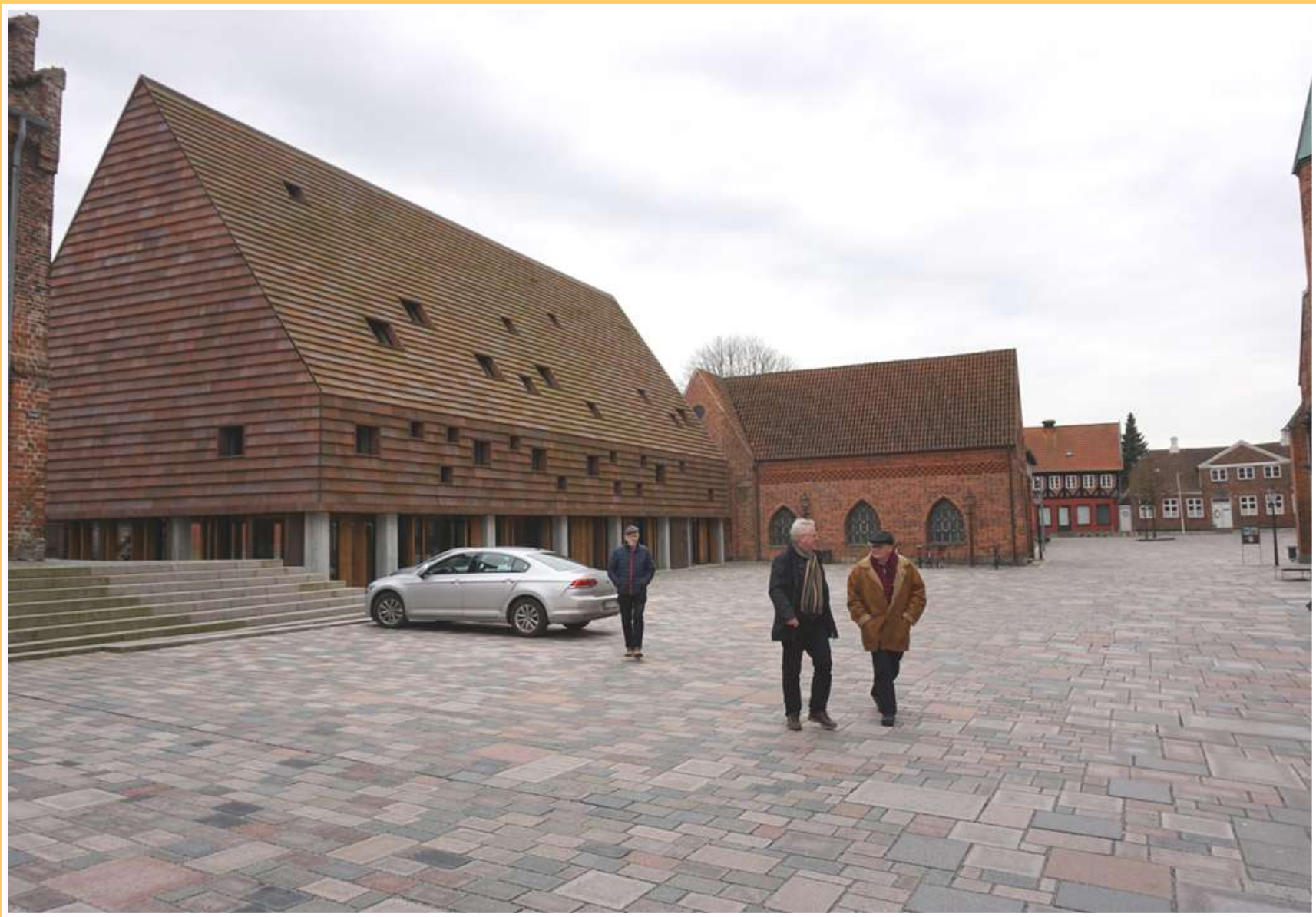
Det nye menighedshus i Ribe