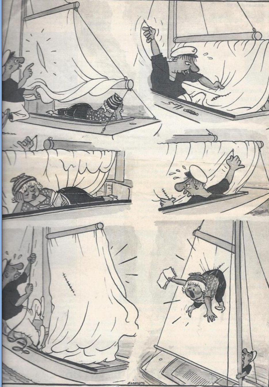
gjort er velgjort . . . Leta og lykke med hoder brakke og Emusk